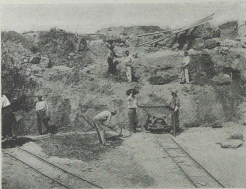
Fig. 18. — Descobrimet de una de les torres de la muralla grega