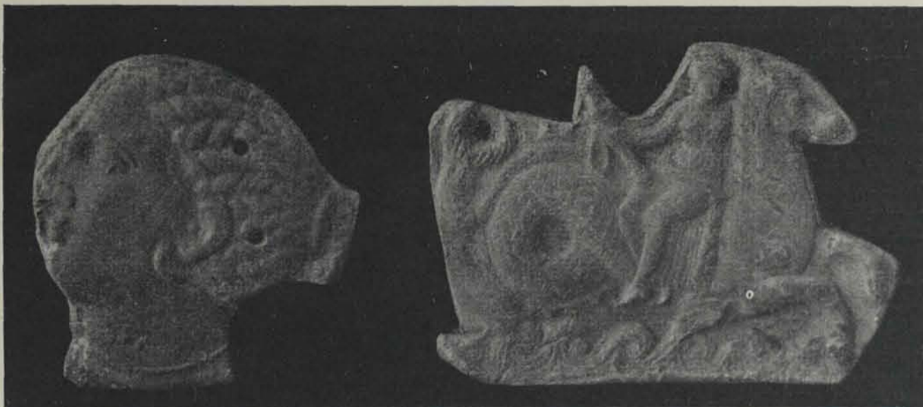
Fig. 16. — Plaques púniques de la col·lecció Vives procedents d'Ibiça

formidable com el d'Ibiça, demostren l'insuficiència de l'actual organització espanyola per cuidar de les antiguitats.