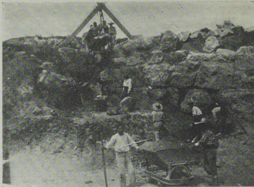
Fig. 17. — Treballs pel descobriment de la muralla grega