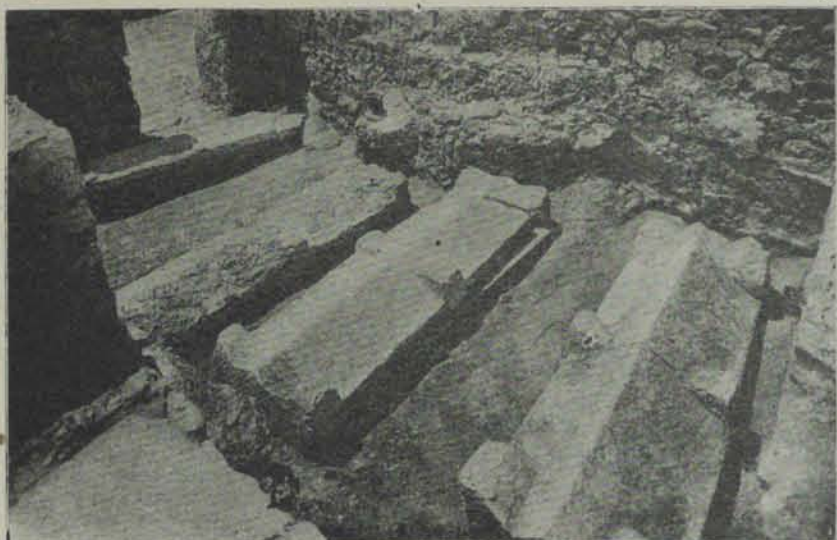
Fig. 19. — Sarcòfechs llisos trobats a les dunes

del senyor Villanueva, se van dibuixar varis mosaichs y començar l'estudi del plan de la suntuosa habitació romana allí descoberta per els treballs y despeses dels propietaris de la finca. Al mosaich que conté en son centre el conegut emblema del sacrifici d'Ifigenia aixecant el plan d'àrea en opus musivum . A més se ha procurat adquirir els objectes de la població prehistòrica dels voltants, alguns dels quals se descriuen en aqueix mateix volum.